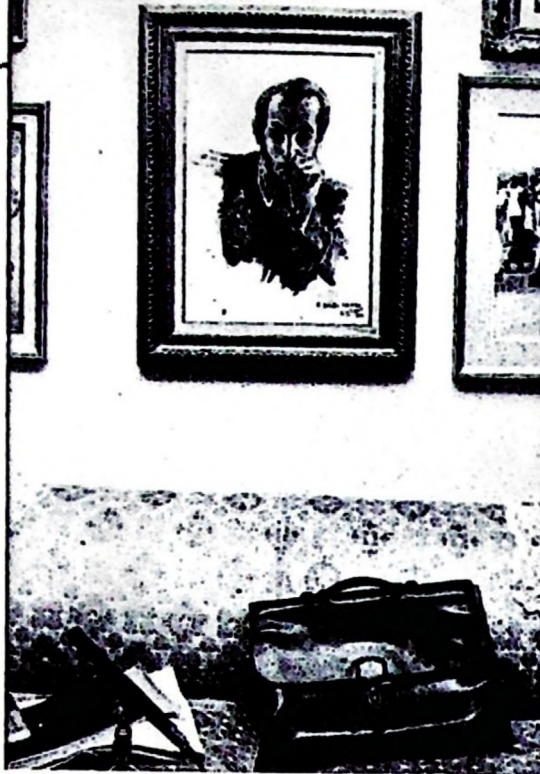
El Libertador pensativo, boceto de Tito Salas dedicado a Rafael Caldera. Debajo, en el sofá, el absorbente micrófono de RESUMEN y el portafolio de nuestro Director.

Rafael Caldera: Así es como yo lo entiendo, y que lo mismo debe ser del lado venezolano, que debe realizarse un proceso en el cual fundamentalmente esté