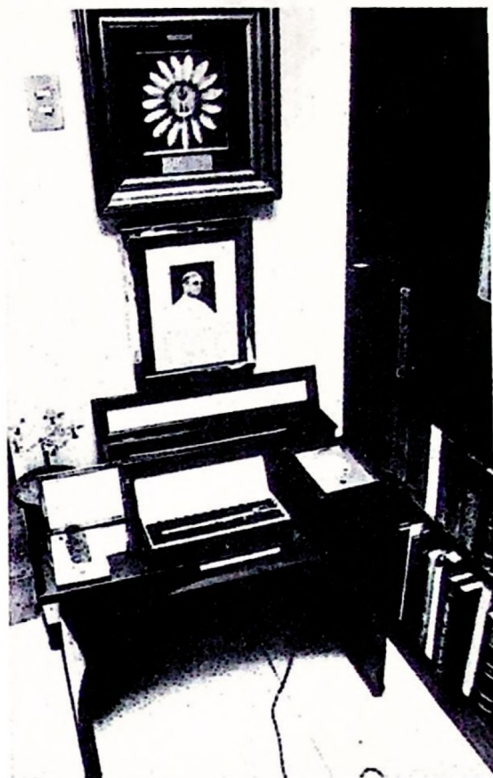
Esta mesita tiene un significado muy especial para Rafael Caldera y para Venezuela. En ella se firmó el "Pacto de Punto Fijo" que tanto hizo por sostener el Gobierno de Rómulo Betancourt . Sobre ella, el Presidente Caldera guarda recuerdos de su presidencia, entre otros, la batuta que le obsequiara el genial catalán Pablo Casals .

participantes es mayor, desde el punto de vista de la calificación de esos participantes, es más cerrado el criterio porque está limitado, exclusivamente, a los miembros del partido, hasta el punto de que aquellos independientes que han querido participar en esta cuestión de la pre-candidatura de Acción Democrática, han tenido que inscribirse en el partido para que se les pueda admitir a tomar parte en el proceso.