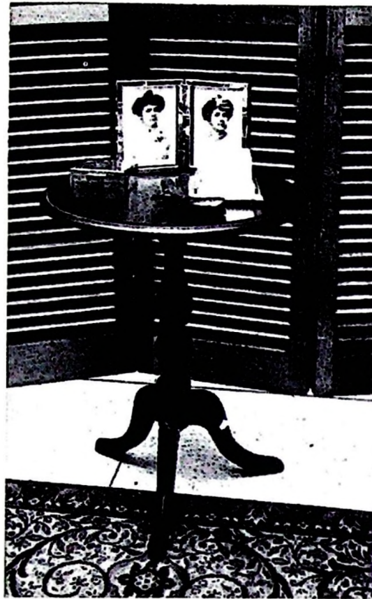
Un hogar donde se respeta la tradición del respeto y afecto a los seres queridos

Jorge Olavarria: Usted ha citado un ejemplo muy bueno, porque la elección del Presidente Carter se hizo bajo una reglamentación muy severa que fue el producto de todo el caos que produjo a su vez el caso de Watergate. Es decir, que las últimas elecciones norteamericanas son muy importantes y deben ser detenidamente estudiadas por los politicólogos venezolanos en el sentido de que se tomaron una serie de disposiciones para controlar muy severamente las contribuciones a los partidos políticos; que las publicidades que se hacían en la televisión, tenían que decir quién estaba pagando esa publicidad; las contribuciones no son deducibles del Impuesto sobre la Renta, tenían que ser declaradas, tenían que ser asentadas en las contabilidades de las empresas o de las personas, etc. Hay una serie de disposiciones muy severas, con penas de cárcel, usted sabe que en los Estados Unidos con esas cosas